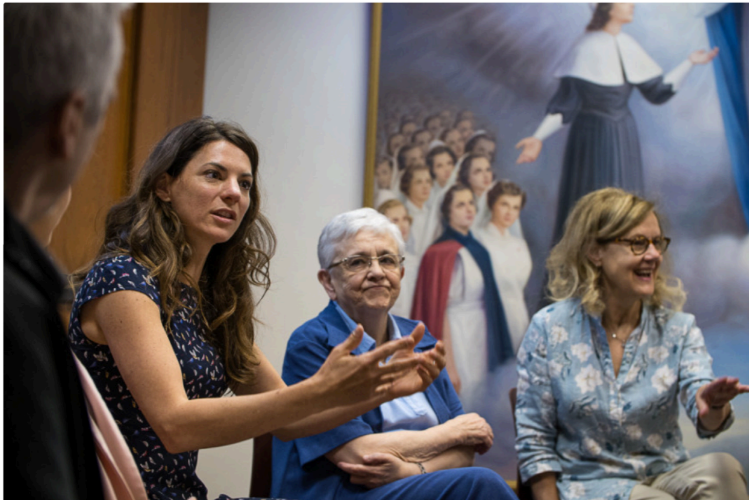
La websérie réalisée par André Waquant traite de l'histoire de 12 Hospitalières interprétées par 12 comédiennes.